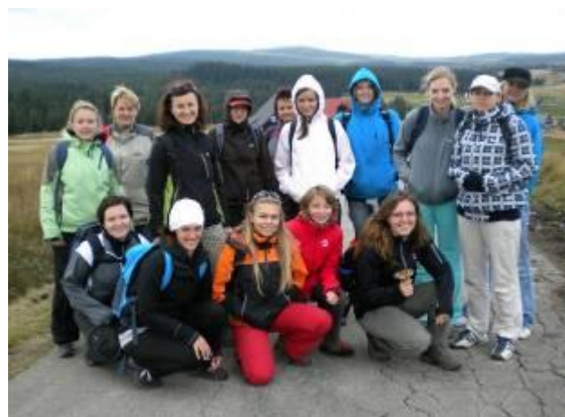
Víkend v pohybu (str. 5)