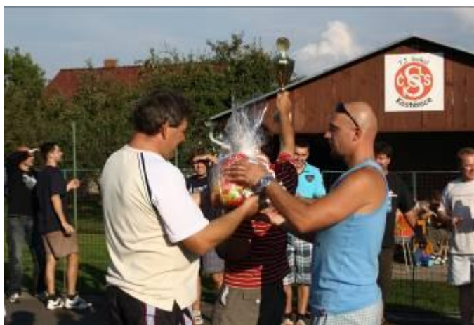
Posvícenský nohejbal (str. 4)