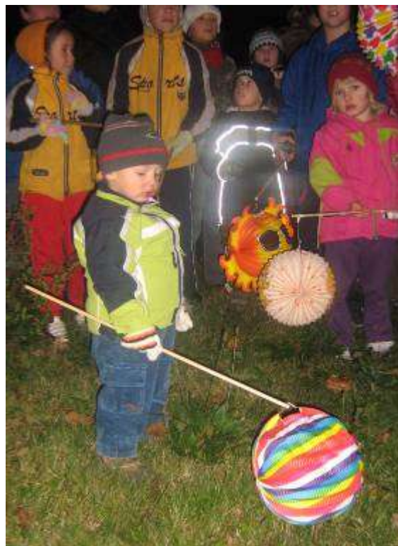
1. 11. 2009 Uspávání broučků