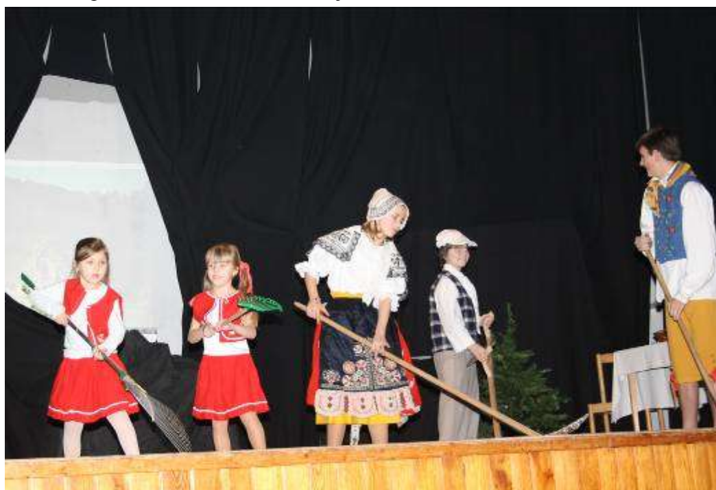
Vánoční pohádka – Princezna ze mlejna 19. 12. 2009